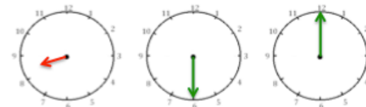
8 h 30 9 h 30 12 h 00

Les heures (petite) en rouge / les minutes (grande) en vert